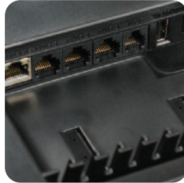
Złącza komunikacyjne - Ethernet, USB, RS232