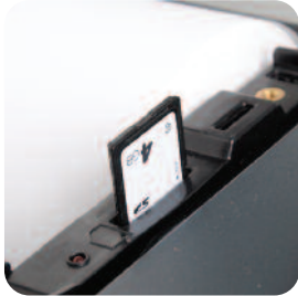
Kopia elektroniczna - wygoda i oszczędność

Kasa NEO XL drukuje NIP nabywcy na paragonie z równoczesną kontrolą wartości takiego paragonu. Funkcja ta pozwala zaprogramować maksymalną wartość paragonu, przy której NIP klienta będzie drukowany. Według obecnych przepisów, NIP nabywcy możemy drukować na paragonach o wartości do 450 PLN lub 100 EUR.