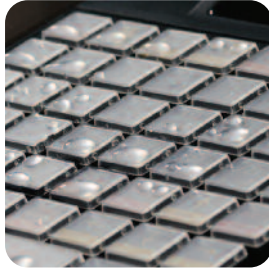
Klawiatura odporna na zachlapanie