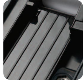
Mechanizm drukujący - prowadzenie papieru