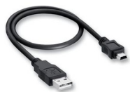
Kabel sygnałowy drukarka – komputer