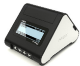
Drukarka Posnet Trio Online