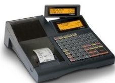
Kasa fiskalna Posnet NEO EJ